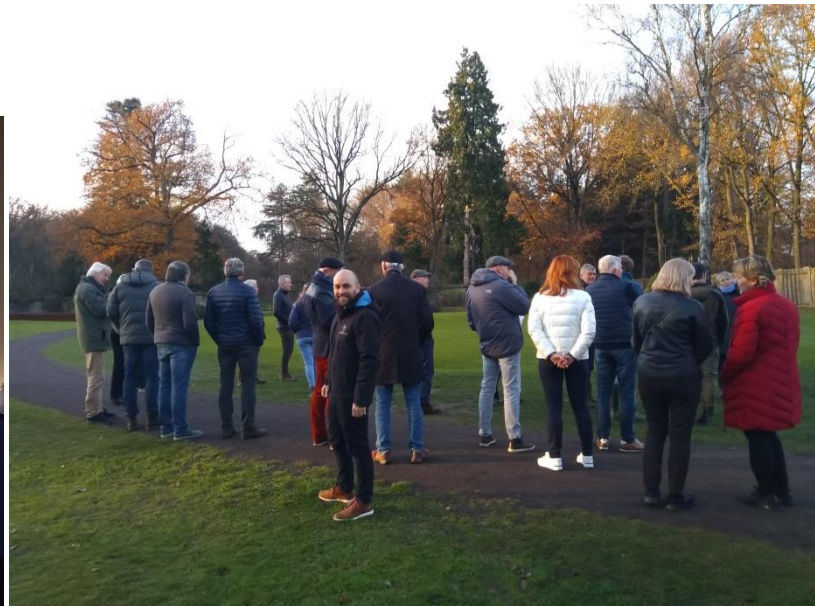
Prachtige natuur op de baan van Golfclub Anderstein in Maarsbergen