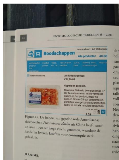
Figuur 27. De import van gepelde rode Amerikaanse rivierkreeften Procambarus clarkii uit China heeft vanaf de jaren 1990 een hoge vlucht genomen, waardoor de handel in levende kreeften voor consumptie sterk gedaald is.