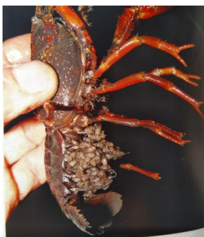
Figuur 13. Vrouwtje rode Amerikaanse rivierkreeft Procambarus clarkii met jongen onder de staart.